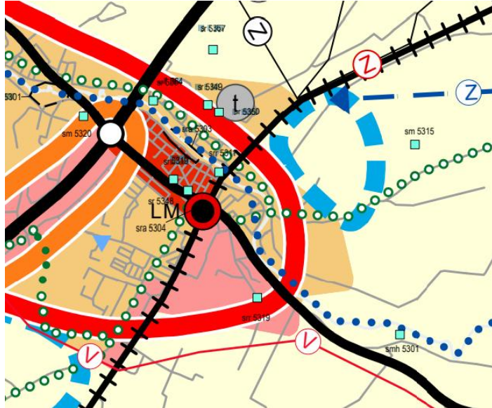
Kuva 3. Ote Varsinais-Suomen maakuntakaavayhdistelmästä. Kaava-alueen likimääräinen sijainti on merkitty vihreällä ympyrällä.

Suunnittelualue on osoitettu kokonaisuudessaan maakuntakaavassa maa- ja metsätalousvaltaiseksi alueeksi (M). Suunnittelualueen länsireuna rajautuu Loimaan keskustan itäpuolelle sijoittuvaan työpaikkatoimintojen alueeseen (TP). Seututie (Hämeentie) kulkee suunnittelualueen eteläreunassa. Loimijoki on osoitettu kaavaan veneväylänä tai kanoottireittinä.