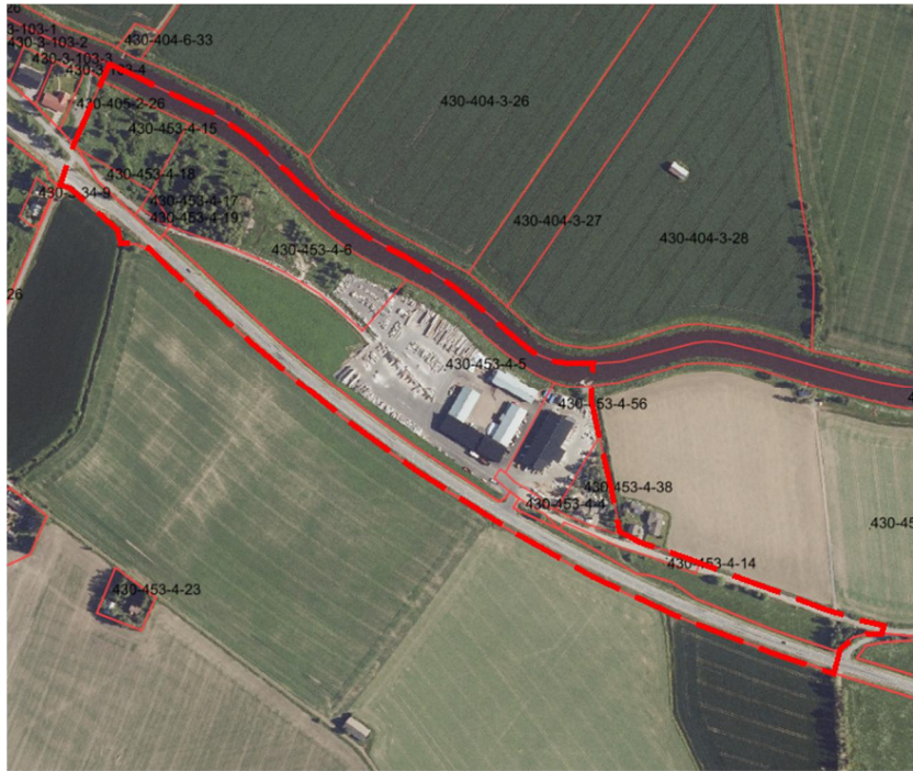
Kuva 1. Kaava-alueen rajausta osoitekartalla.