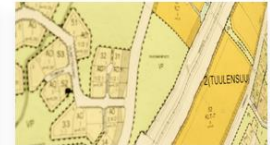
Kaavoitus ja maankäyttö