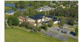
Toimitilat ja kiinteistöt