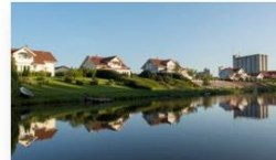
Asuminen ja tontit