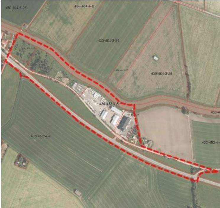
Kuva 1. Kaava-alueen raja-alue osoitekartalla.