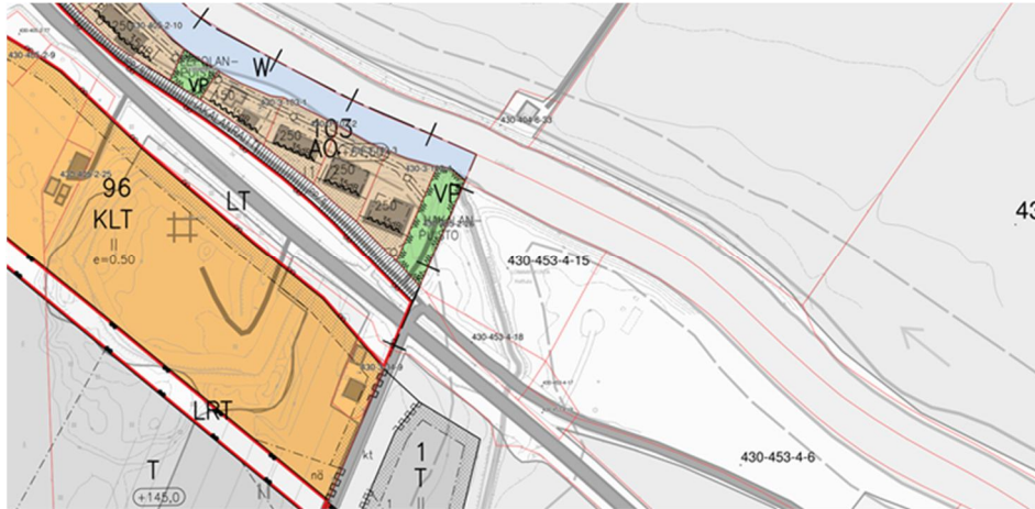
Kuva 5. Ote Loimaan ajantasa-asemakaavasta.