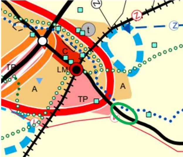
Kuva 3. Ote Varsinais-Suomen maakuntakaavayhdistelmästä. Kaava-alueen likimääräinen sijainti on merkitty vihreällä ympyrällä.