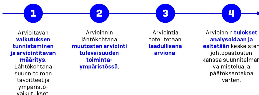
Kuva 4. Vaikutusten arvioinnin eteneminen.

Arvioinnin valmisteluvaiheet on esitetty pääpiirteissään kuvassa 4. Vaikutusten arviointia raamittaa arviointikehikko, johon on kuvattu arvioitavat vaikutusalueet. Vaikutusalueet on kytketty suunnitelmalle asetettuihin tavoitteisiin (liite 2), mikä tehnyt tavoitteiden toteutumisen arvioinnista systemaattista ja läpinäkyvää.