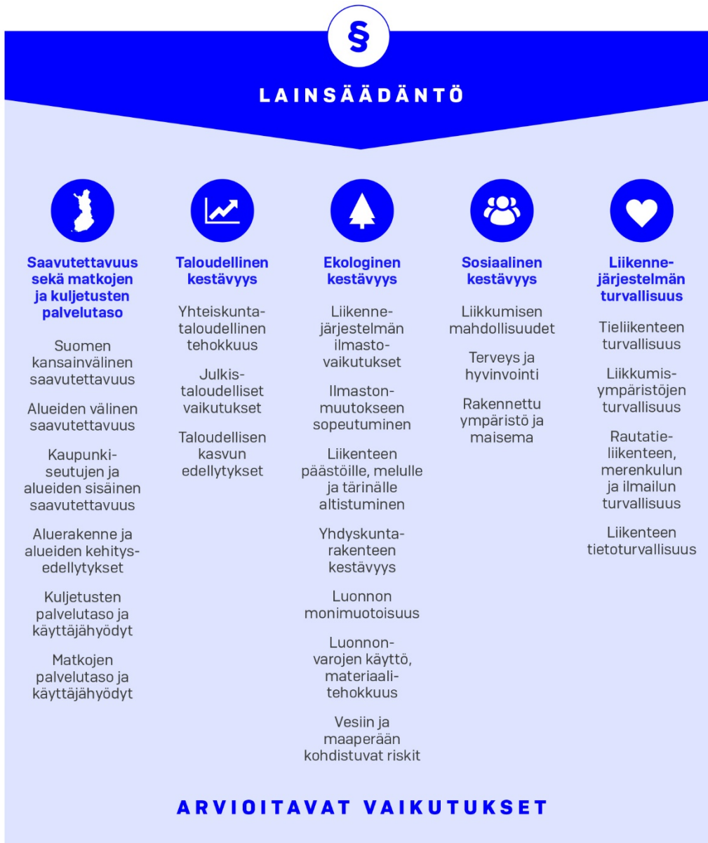
Kuva 3. Arvioitavat vaikutukset (päivitetty 16.3.2020).